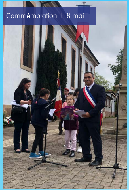
Commémoration | 8 mai