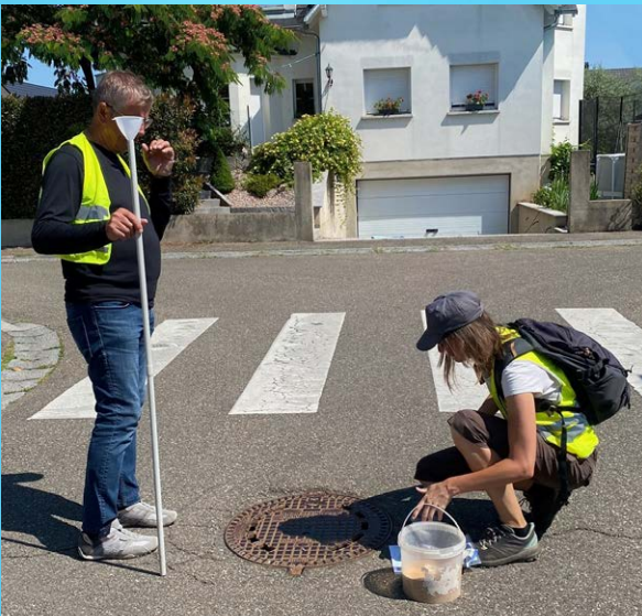
Opération de traitement des avaloirs | 24 juin