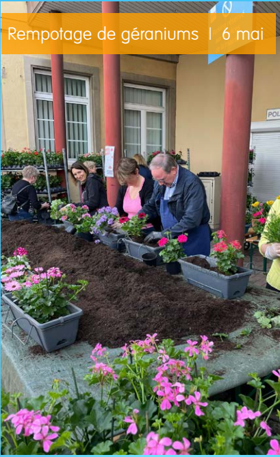
Rempotage de géraniums | 6 mai