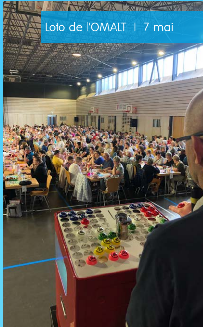
Loto de l'OMALT | 7 mai