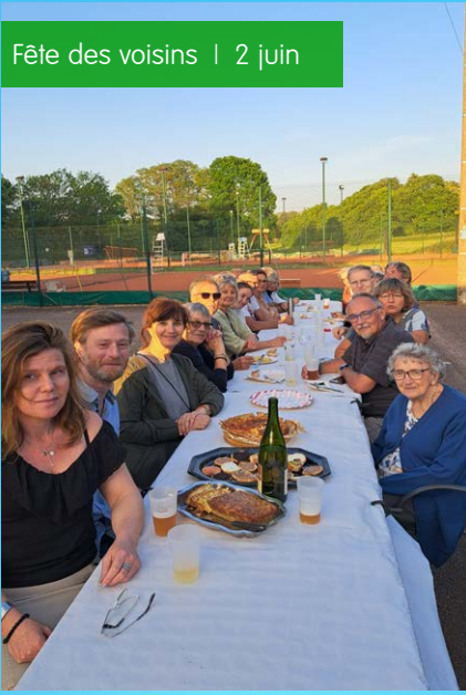
Fête des voisins | 2 juin