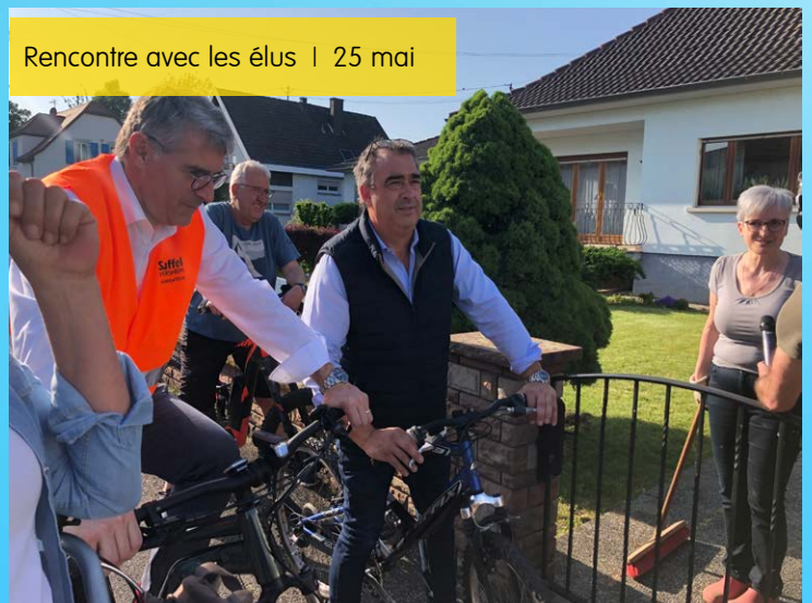
Rencontre avec les élus | 25 mai