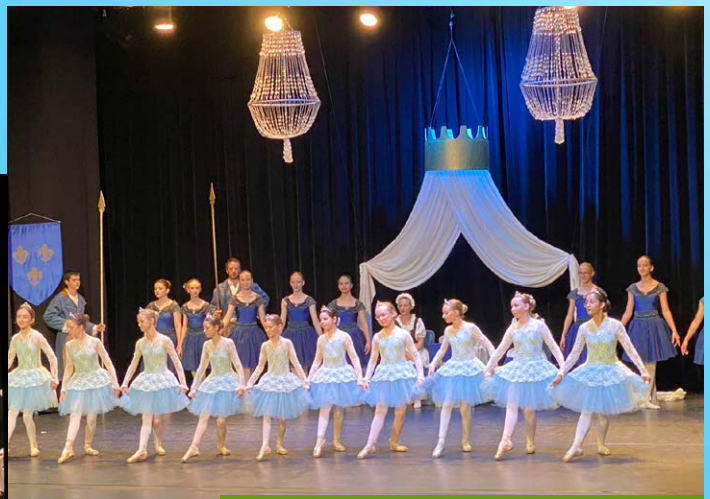
Spéctacle danse Classique | 24-25 juin