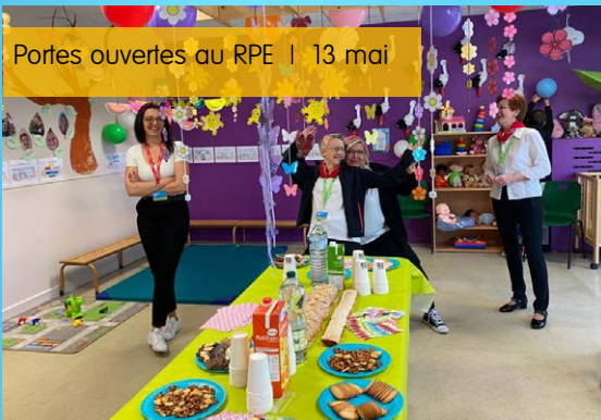
Portes ouvertes au RPE | 13 mai