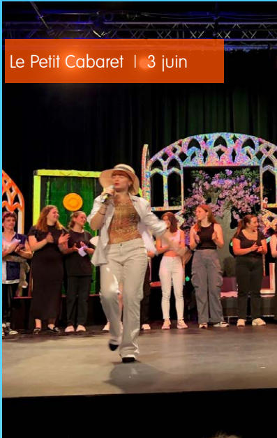
Le Petit Cabaret | 3 juin