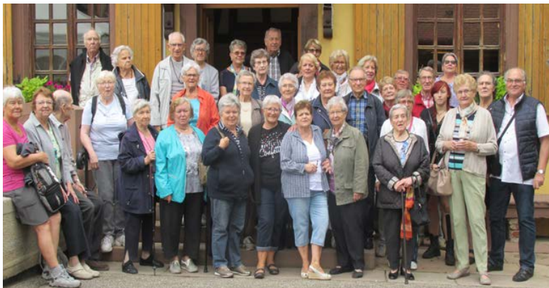
Photo : Sortie à l'ELMERFORST